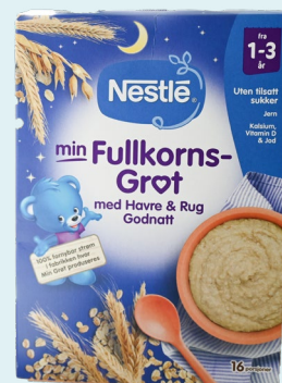
Nestlé Min Fullkornsgrøt med Havre og Rug Godnatt – Fra 1-3 år