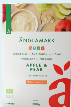
Änglamark Wholegrain porridge Apple & Pear – Fra 6 måneder