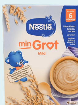
Nestlé Min Grøt Mild – Fra 6 måneder